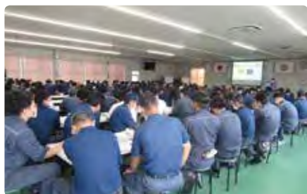
交通講習会（倉敷事業所）