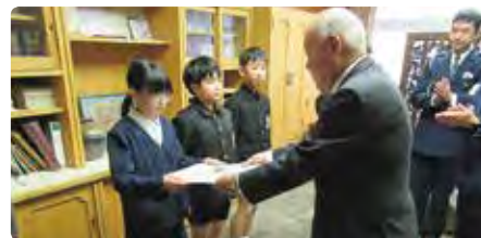
3月5日 岡山市立可知小学校