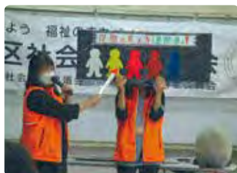
高齢者交通安全教室（岡山西）