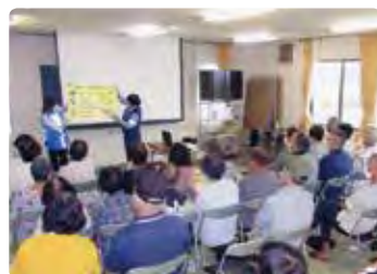
高齢者交通安全教室（岡山南）