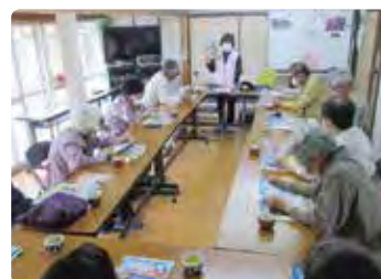
高齢者交通安全教室（美咲）