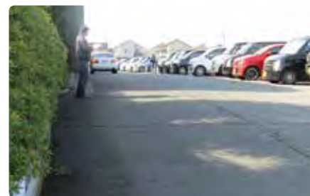
入門チェック状況