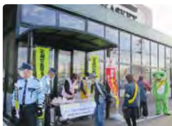
交通安全街頭活動（玉島）