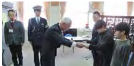
2月8日 赤磐市立山陽東小学校