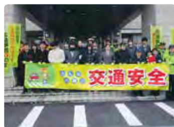
交通安全街頭活動（津山）