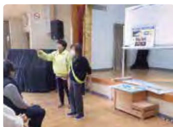
高齢者交通安全教室（真庭）