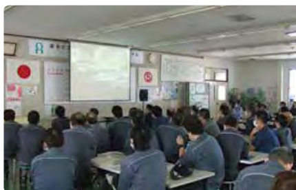
交通講習会（矢掛工場）