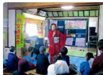
高齢者交通安全教室（児島）