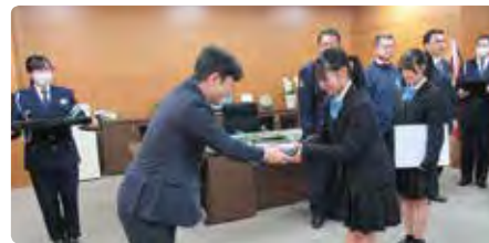
2月13日 岡山県立倉敷天城中学校