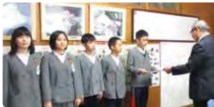
2月9日 備前市立西鶴山小学校