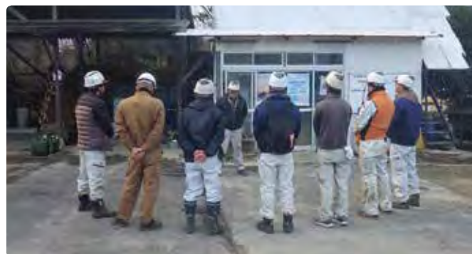
始業前の安全作業ミーティング