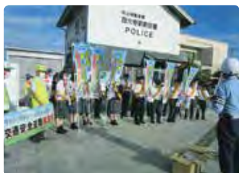
交通安全街頭活動（岡山東）

県内の各警察署に所在する地区交通安全協会は、「交通事故のない安全で安心して暮らせる地域社会の実現」に向け、警察署、市町村・関係機関・団体等と連携して、子どもから高齢者、歩行者、自転車利用者、ドライバーなど道路を利用する多くの皆様に様々な交通安全活動を行っています。活動の一例を紹介します。