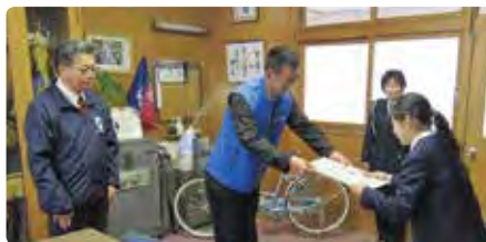
2月29日 岡山市立第一藤田小学校